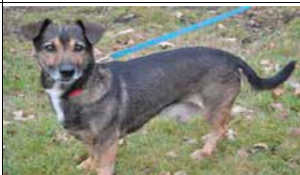
Hiacynt - samiec, wiek 9 lat, kastrowany, 30 cm w kłębie, tylna prawa kończyna amputowana.