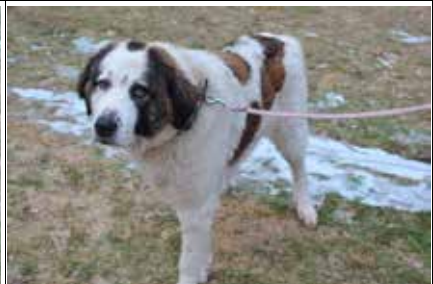
Kropka - samica, wiek 4 lata, niesterylizowana, 75 cm w kłębie.