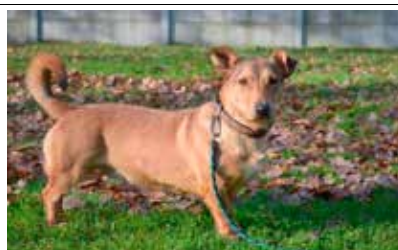
Peper - samiec, wiek 5 lat, kastrowany, 38 cm w kłębie.