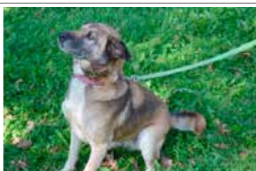
Lu Lu - samica, wiek 9 lat, sterylizowana, 60 cm w kłębie.