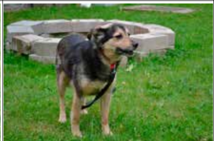
Wicek - samiec, wiek 2 lata, kastrowany, 50 cm w kłębie.