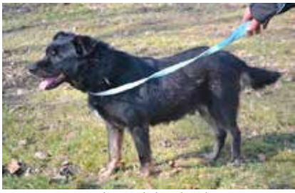
Narcyz - samiec, wiek 9 lat, kastrowany, 55 cm w kłębie.