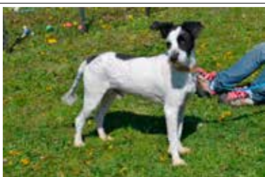
Dżeki 2 - samiec, wiek - 6 lat, kastrowany, 53 cm w kłębie.