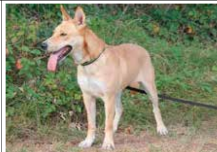
Dora - samica, wiek 6 lat, sterylizowana, 60 cm w kłębie.