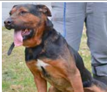
Dżeki - samiec, wiek 9 lat, kastrowany, 60 cm w kłębie.