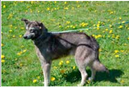
Szarik - samiec, wiek 5 lat, kastrowany, 50 cm w kłębie.