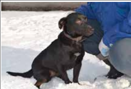
Beret - samiec, wiek 3 lata, kastrowany, 40 cm w kłębie.