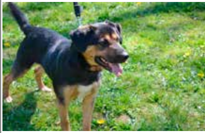
Poldek - samiec, wiek 7 lat, kastrowany, 50 cm w kłębie.