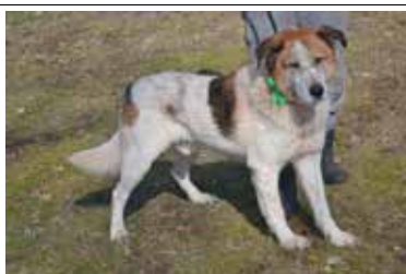
Felek - samiec, wiek 7 lat, kastrowany, 65 cm w kłębie.