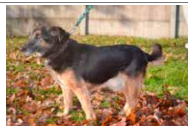
Astor - samiec, wiek 12 lat, kastrowany, 38 cm w kłębie.