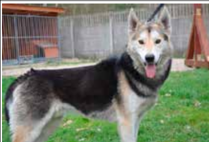
Kuba - samiec, wiek 4 lata, kastrowany, 58 cm w kłębie.