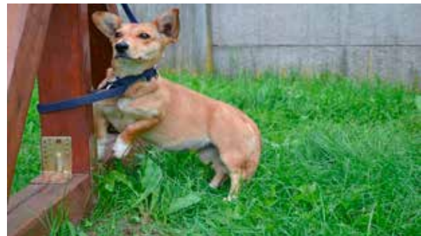
Dolores - samica, wiek 3 lata, niesterylizowana, 30 cm w kłębie.