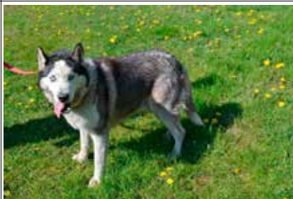
Ziomek - samiec, wiek 9 lat, kastrowany, 55 cm w kłębie.