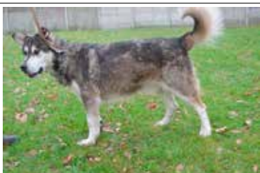
Roch - samiec, wiek 7 lat, kastrowany, 60 cm w kłębie.