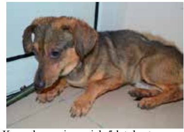
Knypek- samiec, wiek 5 lat, kastrowany, 25 cm w kłębie, bojaźliwy.