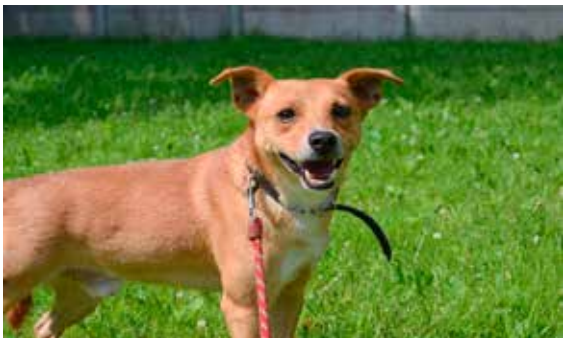
Rydz - samiec, wiek 3 lata, niekastrowany, 40 cm w kłębie.