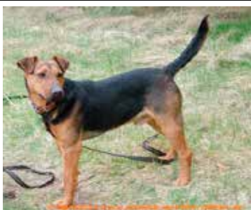
Opel - samiec, wiek 9 lat, kastrowany, 45 cm w kłębie.

Godziny otwarcia schroniska - codziennie w godzinach od 9.00 do 18.00.