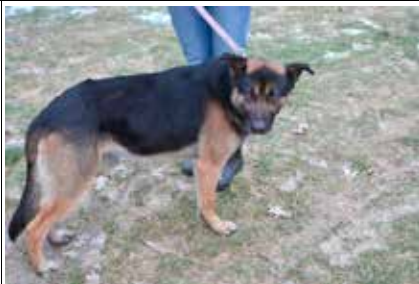
Odi - samiec, wiek - 4 lata, kastrowany, 60 cm w kłębie.