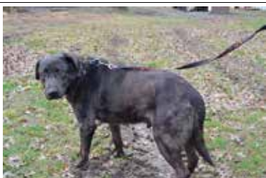
Onet - samiec, wiek 9 lat, niekastrowany, 63 cm w kłębie, choruje na niedoczynność nerek.