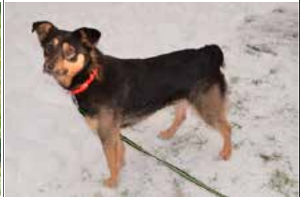
Milik - samiec, wiek 3 lata, kastrowany, 53 cm w kłębie.