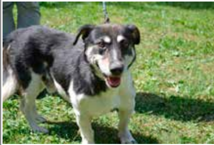
Kumpel - samiec, wiek 7 lat, kastrowany, 40 cm w kłębie.