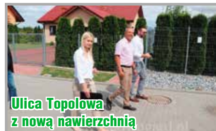
Ulica Topolowa z nową nawierzchnią