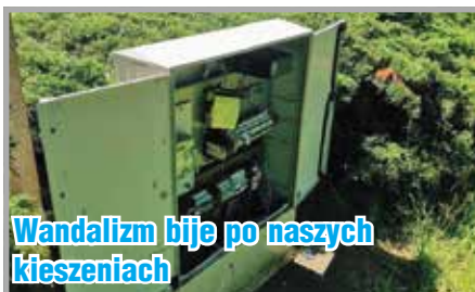
Wandalizm bije po naszych kieszeniach