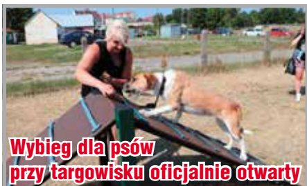
Wybieg dla psów przy targowisku oficjalnie otwarty