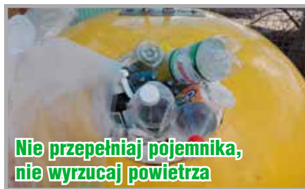
Nie przepełniaj pojemnika, nie wyrzucaj powietrza