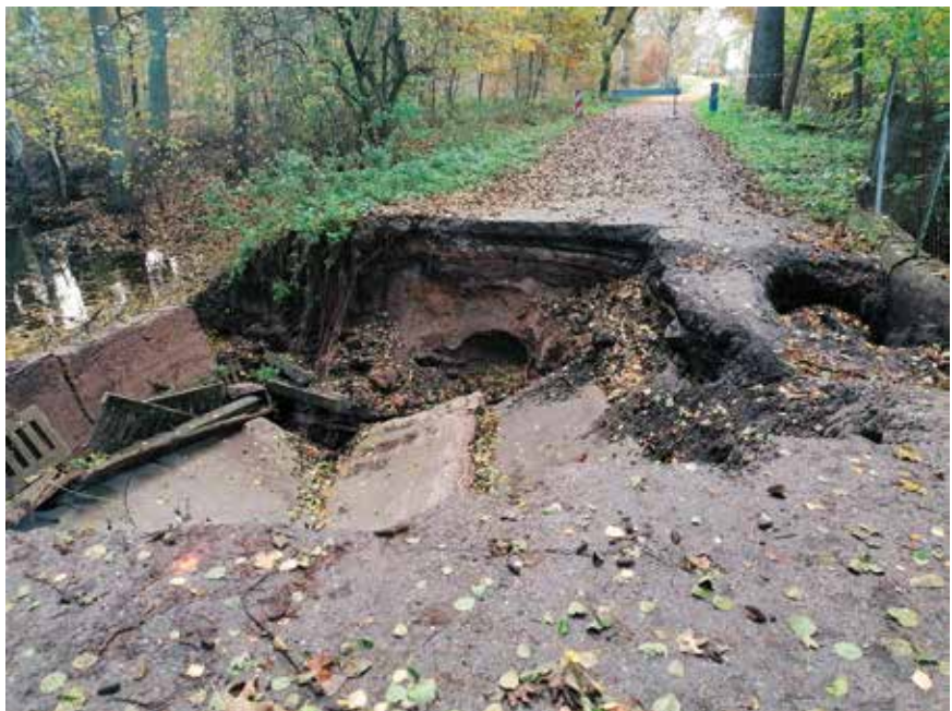
Tak prezentuje się zarwany przepust w miejscowości Boguszyce

Cieszę się że burmistrz słowa danego mieszkańcom dotrzymuje i podpisał przetarg. Za kilka miesięcy będziemy mieli nowy przepust drogowy na który wszyscy czekamy z niecierpliwością. Po trzech miesiącach sprawowania funkcji sołtysa powiem śmiało współpraca z burmistrzem układa