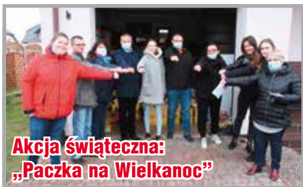
Akcja świąteczna: „Paczka na Wielkanoc”