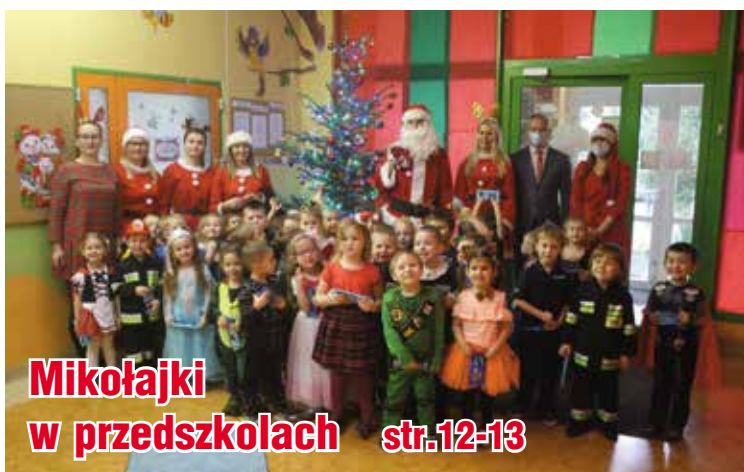
Mikołajki w przedszkolach str.12-13