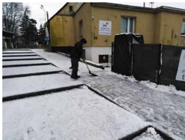
Odśnieżanie przejść i schodów