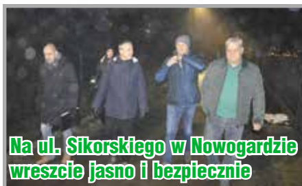
Na ul. Sikorskiego w Nowogardzie wreszcie jasno i bezpiecznie