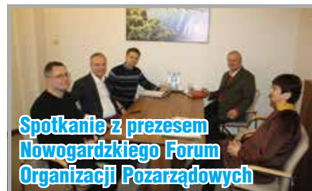
Spotkanie z prezesem Nowogardzkiego Forum Organizacji Pozarządowych