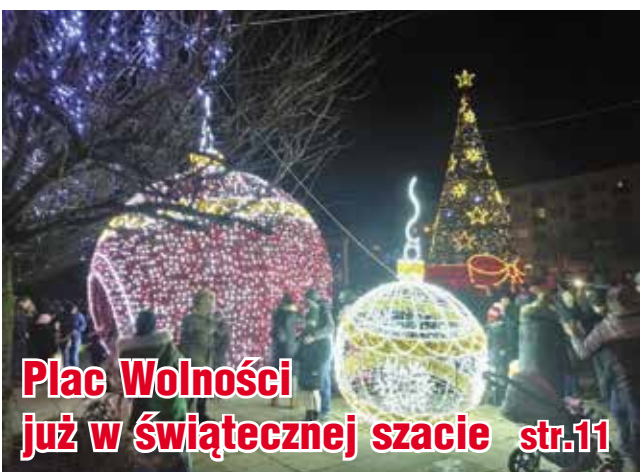
Plac Wolności już w świątecznej szacie str.11