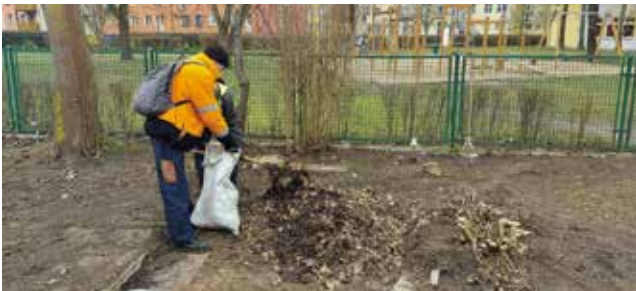
Sprzątanie ul. Gen. Bema