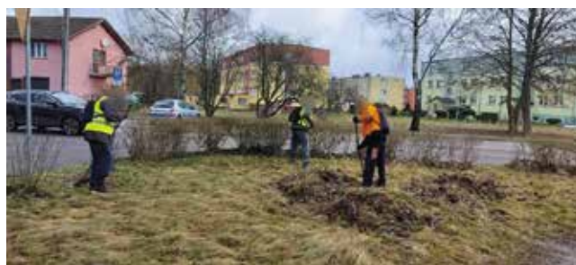
Sprzątanie zieleńców i parkingów przy ulicach: Bema i Leśnej