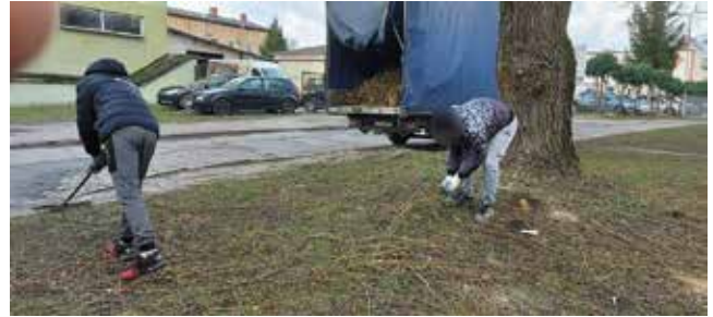
Sprzątanie - ul. Zamkowa