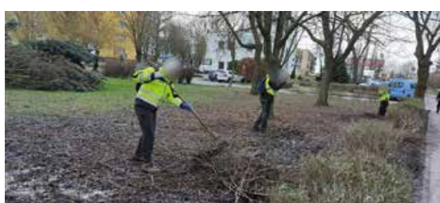
Sprzątanie ścieżki, zieleńców - ul. Zielona