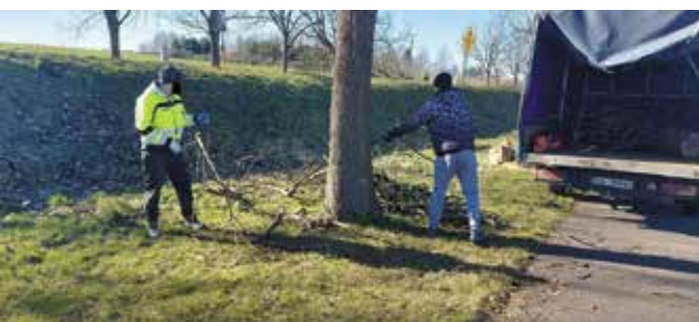
Sprzątanie ścieżki Nowogard - Olchowo