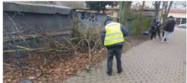
Sprzątanie ul. Piłsudskiego