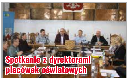
Spotkanie z dyrektorami placówek oświatowych