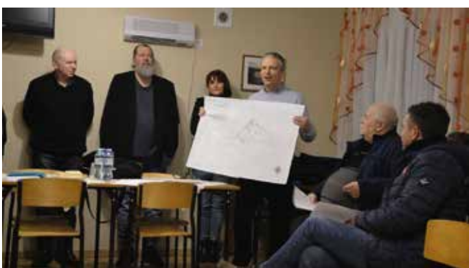
Mieszkańcy Karska zdecydowali o tym, jak ma wyglądać ich świetlica str.2