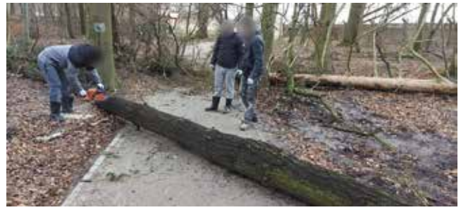
Usuwanie zwalonych drzew na ścieżkach