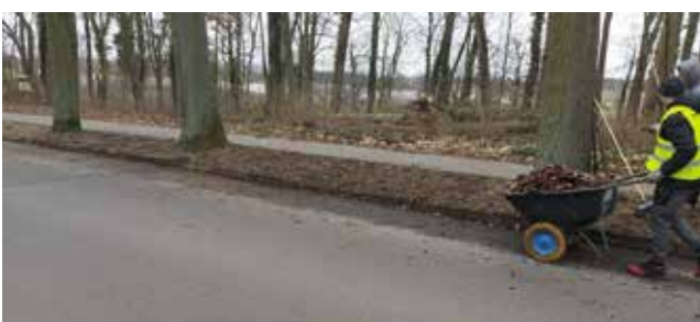
Sprzątanie ul. Woj.Polskiego