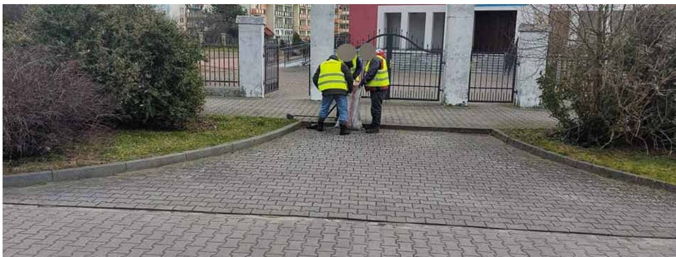
Sprzątanie chodników - ul. Jana Pawła