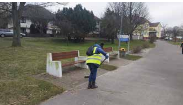
Sprzątanie przy fontannie oraz ścieżki nad jeziorem