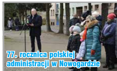
77. rocznica polskiej administracji w Nowogardzie