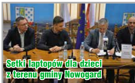
Setki laptopów dla dzieci z terenu gminy Nowogard