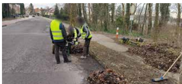
Grabienie liści - ul. Woj. Polskiego