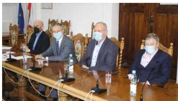
Spotkanie z przedstawicielami służb mundurowych str.3