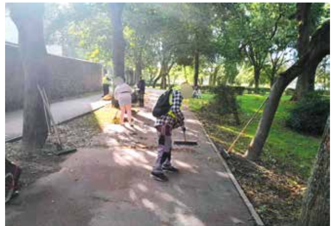
Zamiatanie i hakanie brzegów krawężników na ścieżce pieszo-rowerowej

OBWIESZCZENIE Komisji Okręgowej Nr 3.160. w NOWOGARDZIE ..... Informuję członków Izby Rolniczej, że Komisja Okręgowa Nr 3.160. w ...NOWOGARDZIE ..... będzie przyjmować zgłoszenia kandydatów do rad powiatowych Zachodniopomorskiej Izby Rolniczej w dniu 1.10. NRZEŚNIA o godzinie 10 00 -12 00 W (miejsce, adres) ...NOWOGARDZKI DOM ...KULTURY ...PLAC WOLNOŚCI 4, 72-200 NOWOGARD WEJŚCIE BOCZNE OD ULICY CZARNIECKIEGO SALA nr. 4