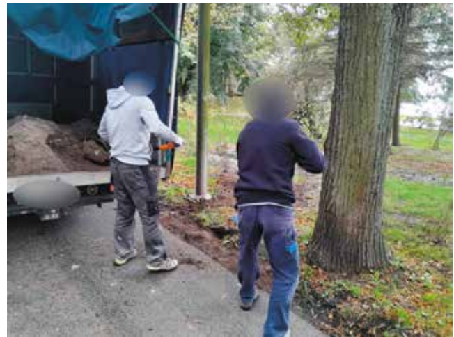
Sprzątanie i wywożenie ziemi po ulewnych deszczach na trawnikach nad jeziorem