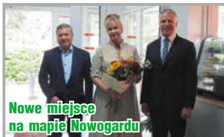
Nowe miejsce na mapie Nowogardu