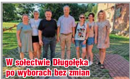
W sołectwie Długotęka po wyborach bez zmian