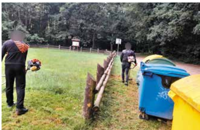
Koszenie polany na smużynach