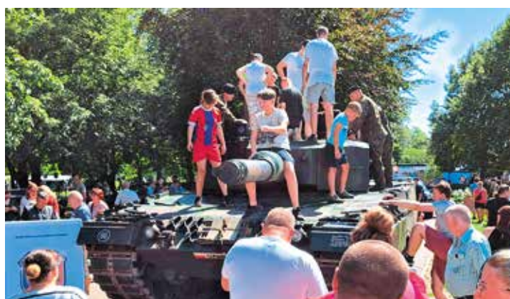
Tłumy na pikniku wojskowym w Nowogardzie