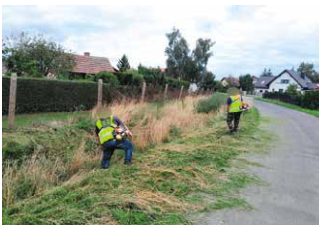
Koszenie rowów przy ul. Ogrodowej