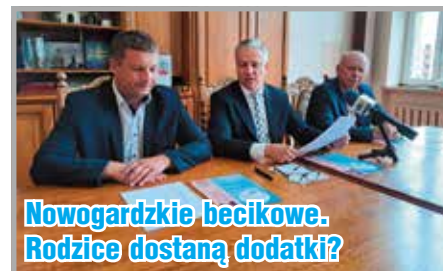
Nowogardzkie becikowe. Rodzice dostaną dodatki?