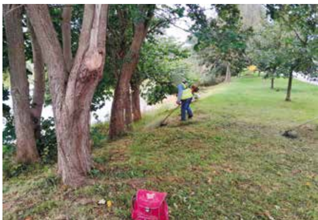
Koszenie terenów zielonych ul. Boh. Warszawy