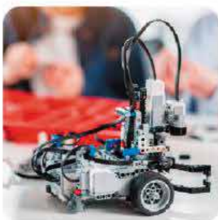
Robotyka 8-12 lat