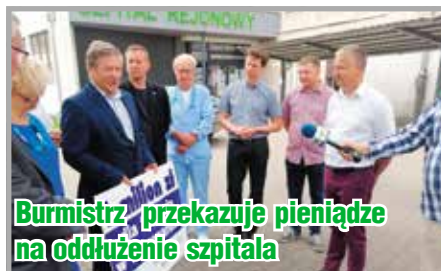
Burmistrz przekazuje pieniądze na oddłużenie szpitala