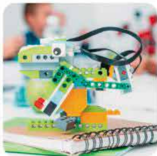
Robotyka 5-7 lat