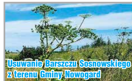
Usuwanie Barszczu Sosnowskiego z terenu Gminy Nowogard