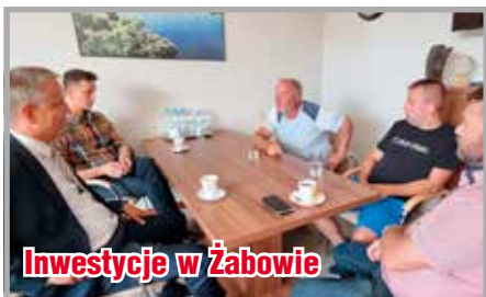
Inwestycje w Żabowie