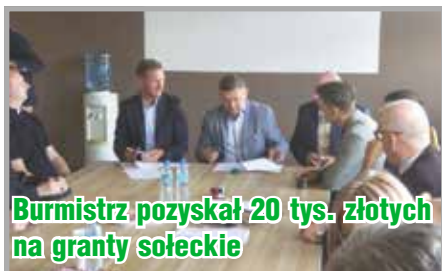
Burmistrz pozyskał 20 tys. złotych na granty sołeckie