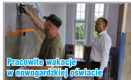
Pracowite wakacje w nowogardzkiej oświacie