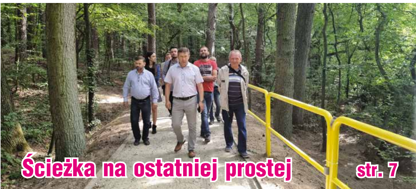
Ścieżka na ostatniej prostej