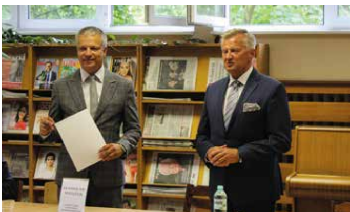
Kompleksowa modernizacja parkietu w SP1