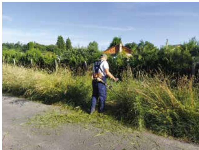
Koszenie trawy w rowach i poboczach łącznik Sieciechowo - do ul. Ogrodowej