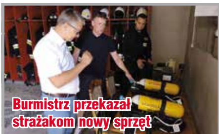
Burmistrz przekazał strażakom nowy sprzęt