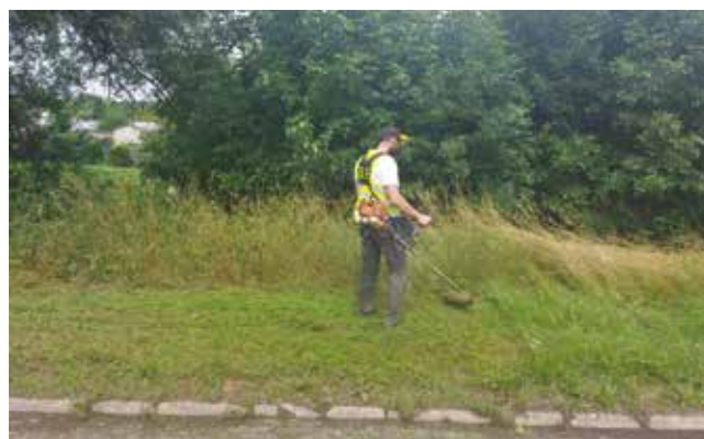
Koszenie trawy przy działkach ul. Zamkowej