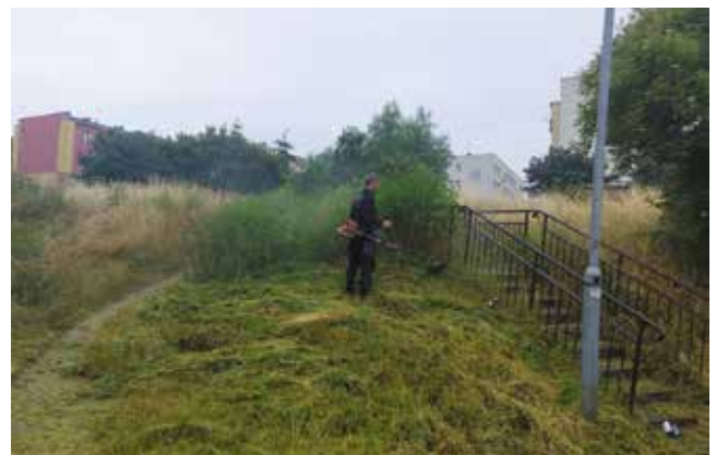
Koszenie przy siłowni i skarpie - ul. Waryńskiego i Kilińskiego