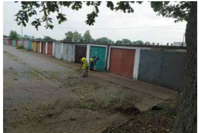
Koszenie terenów zielonych przy garażach ul. Zamkowej