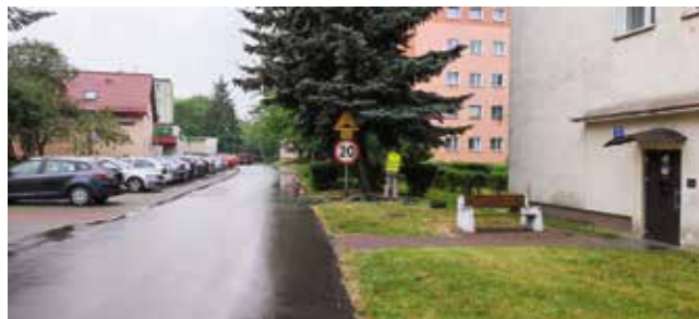
Koszenie trawy i porządkowanie przy śmietnikach na ul. 5 Marca