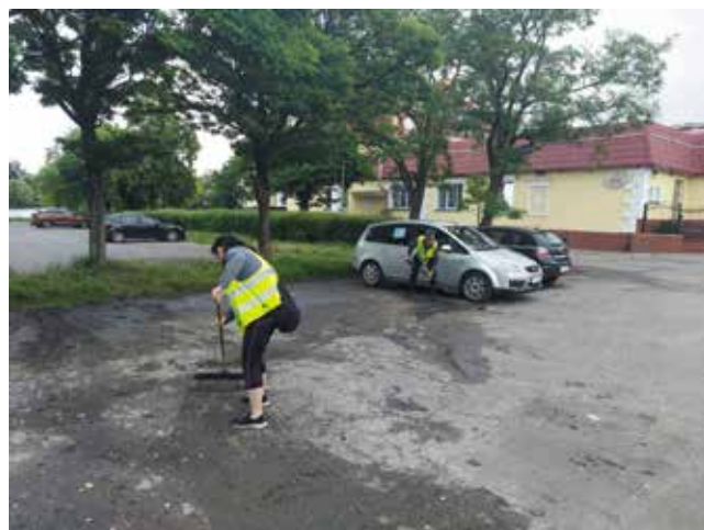
Czyszczenie kanalizacji deszczowej ul. Zamkowa , ul. Warszawska , ul. Kowalska, ul. 700 Lecia, ul. Zielona, parking przy Przystani