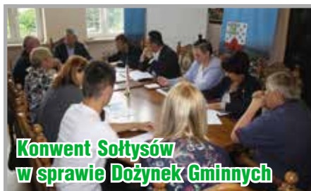
Konwent Sołtysów w sprawie Dożynek Gminnych