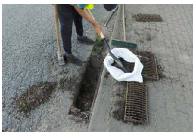
Czyszczenie studzienek kanalizacji deszczowej drogi wojewódzkiej od ul. 3 Maja - stacja Orlen do ul. G. Bema przy kościele