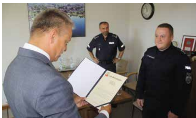
Nowy Komendant KP w Nowogardzie