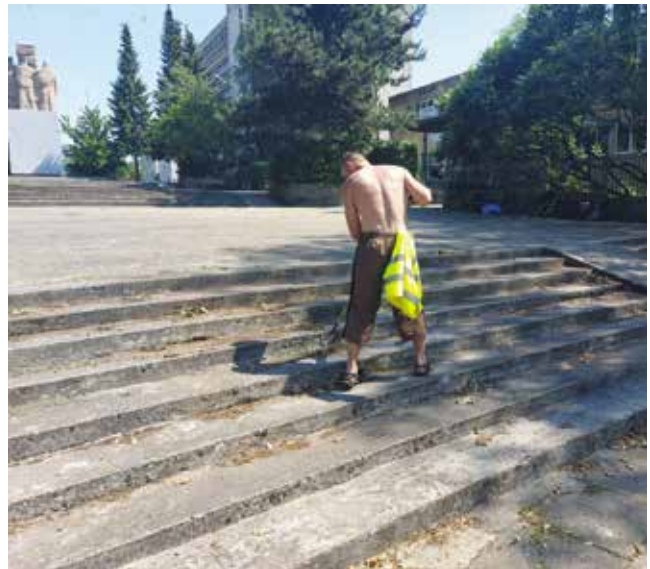
Porządki za pomnikiem schody - odchwasczanie i zamiatanie