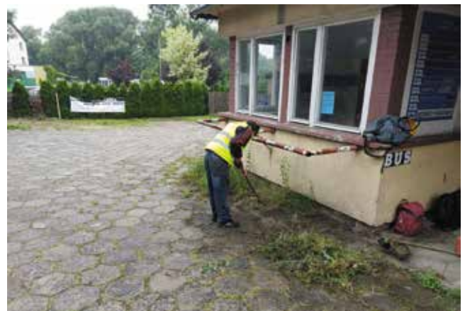
Przycinka gałęzi i hakanie przerostu trawy wokół obiektu PSS ul. 3 Maja