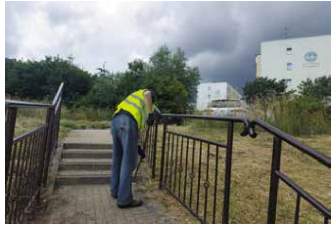
Oczyszczanie obrzeży krawężników i usuwanie przerostów trawy z kostki brukowej garaży na ul. Zamkowej