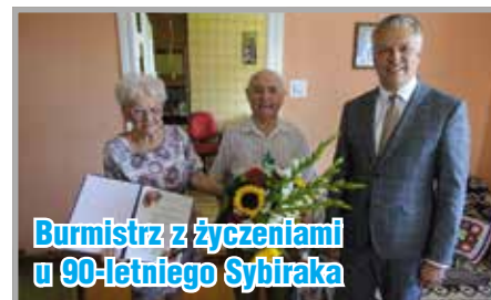
Burmistrz z życzeniami u 90-letniego Sybiraka