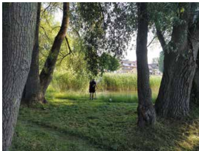
Koszenie trawy przy stawku ul. Radosława