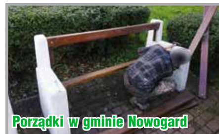
Porządki w gminie Nowogard