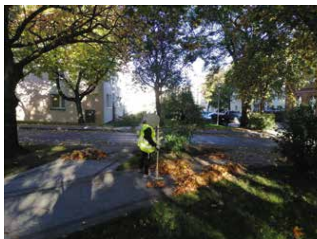
Grabienie liści - skwer przy szalecie miejskim i chodnik przy Placu Wolności