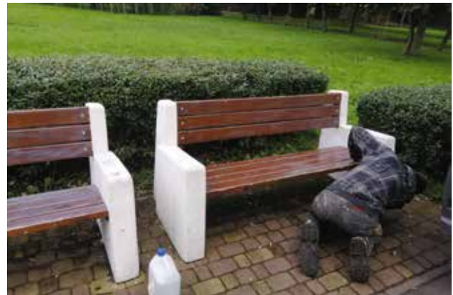
Naprawa ławek przy ścieżce rowerowo-piesznej przy jeziorze

Miejska Biblioteka Publiczna zaprasza do udziału