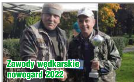
Zawody wędkarskie nowogard 2022