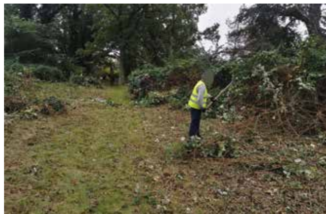
Grabienie liści i porządki na cmentarzu w Świerczewie