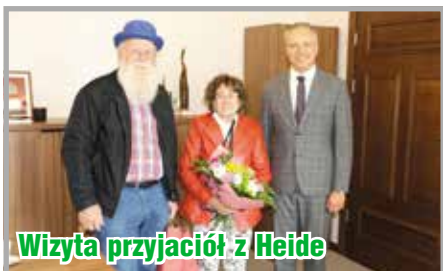
Wizyta przyjaciół z Heide