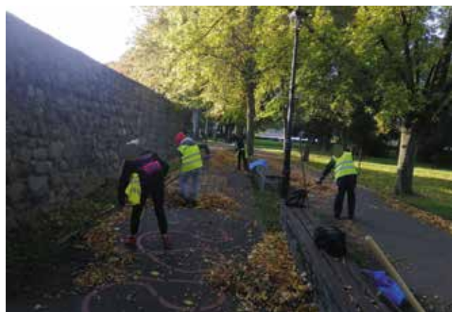
Grabienie liści przy murach miejskich i na schodach za pomnikiem