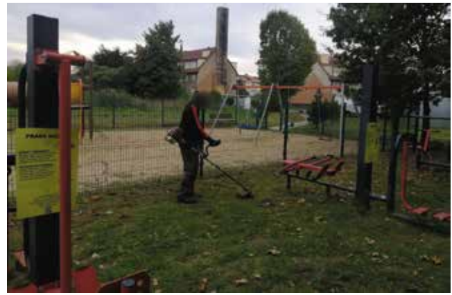
Koszenie trawy i poźdki wokół placu zabaw i siłowni na ul. Radośława