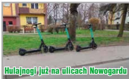
Hulajnogi już na ulicach Nowogardu