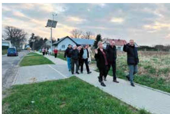
Chodnik w Karsku przekazany do użytkowania