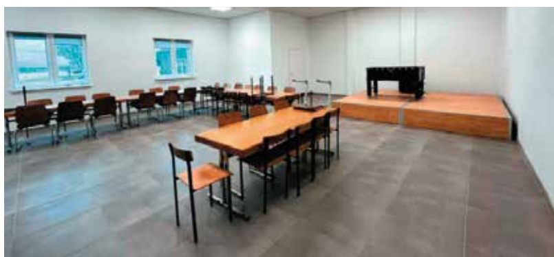
Wołowiec z odnowioną świetlicą i przed realizacją kolejnej inwestycji