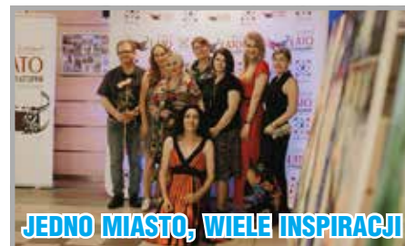
JEDNO MIASTO, WIELE INSPIRACJI