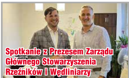
Spotkanie z Prezesem Zarządu Głównego Stowarzyszenia Rzeźników i Wędliniarzy