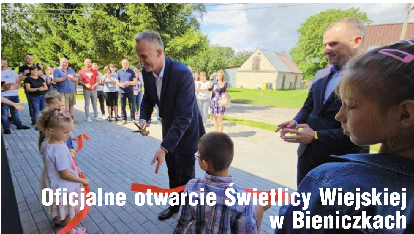
Oficjalne otwarcie Świetlicy Wiejskiej w Bieniczkach