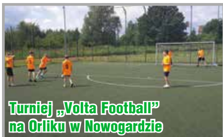
Turniej „Volta Football” na Orliku w Nowogardzie